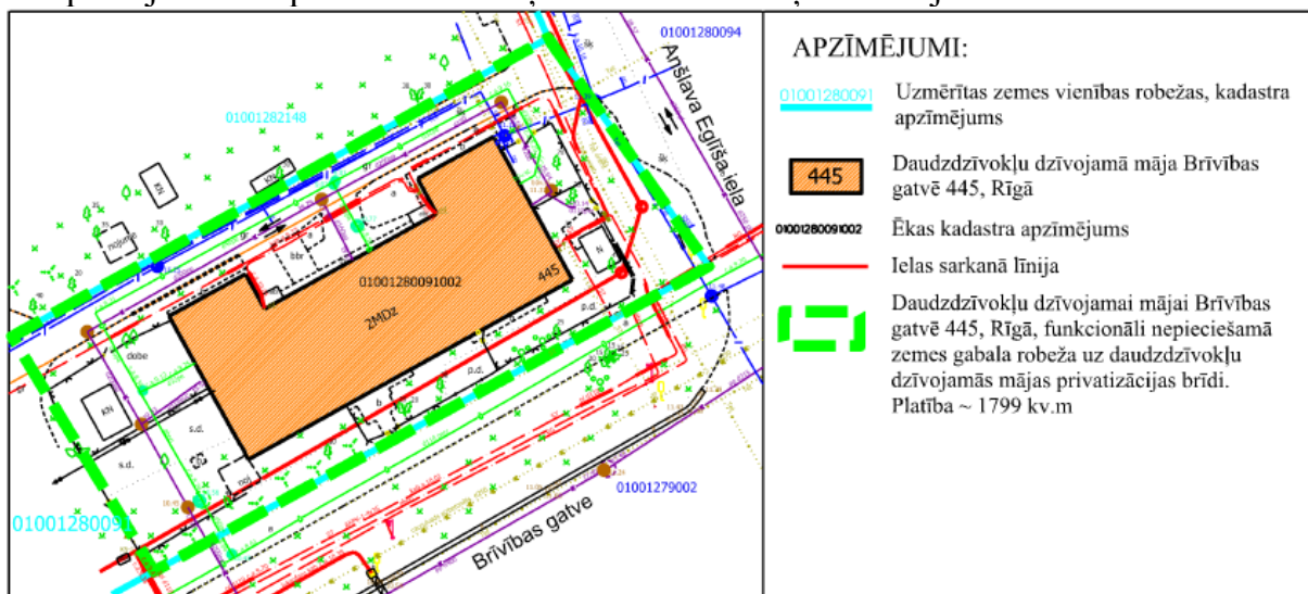
1.attēls Daudzdzīvokļu dzīvojamai mājai Brīvības gatvē 445, Rīgā, funkcionāli nepieciešamā zemesgabala robeža uz daudzdzīvokļu dzīvojamās mājas privatizācijas brīdi

Papildus automašīnas iespējams izvietot izbūvējot papildus autonovietnes respektējot esošo piebraucamo ceļu struktūru un zaļo teritoriju.